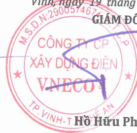
Hồ Hữu Phước